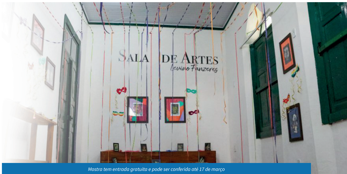
Mostra tem entrada gratuita e pode ser conferida até 17 de março