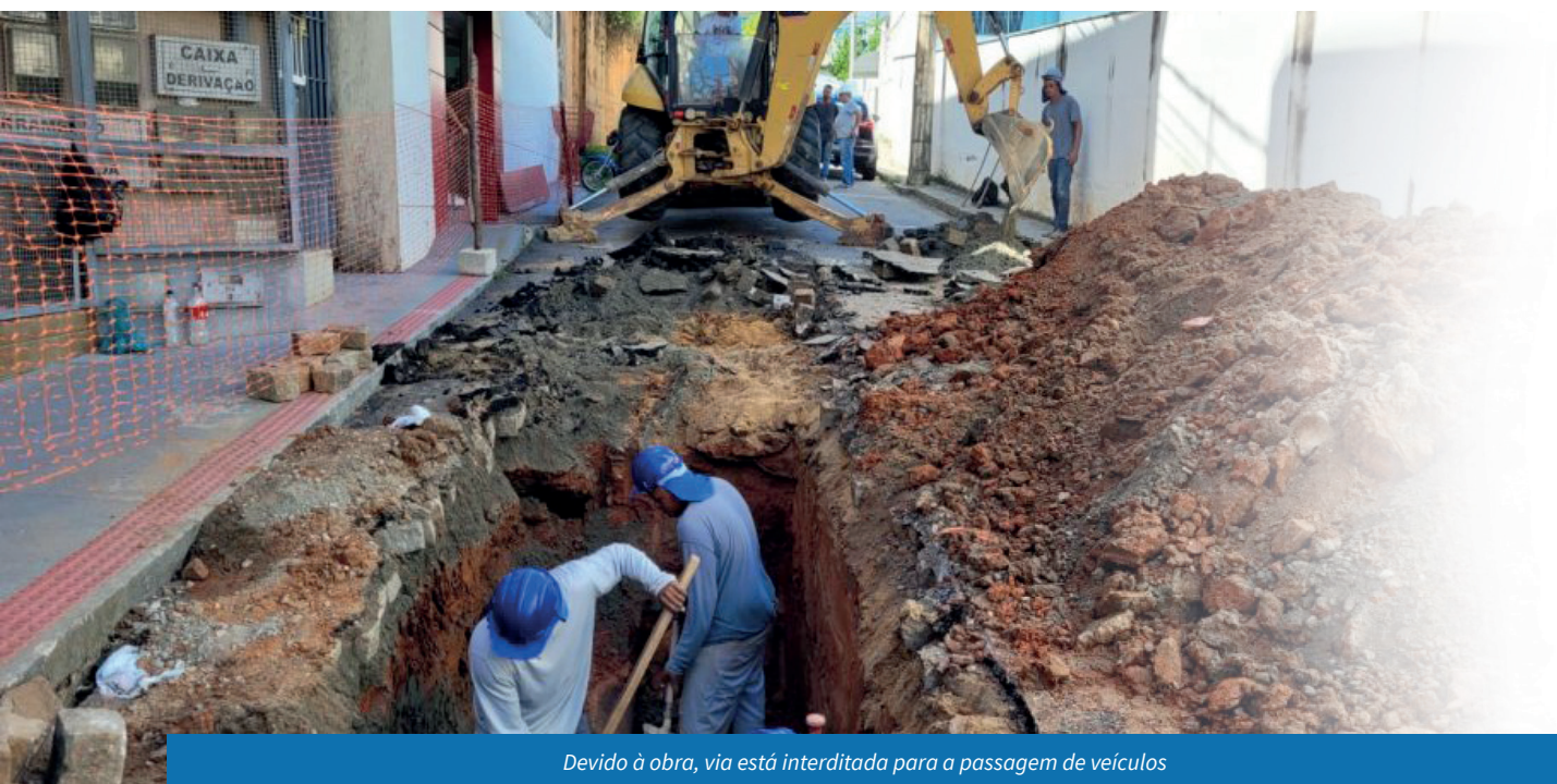
Devido à obra, via está interditada para a passagem de veículos