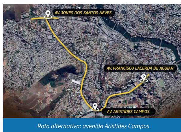
Rota alternativa: avenida Aristides Campos

Já a retomada do recapeamento na Aristides Campos está prevista, a princípio, para sábado (4). Há possibilidade de que o serviço seja concluído na próxima semana.