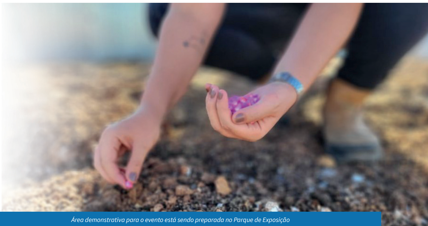
Área demonstrativa para o evento está sendo preparada no Parque de Exposição