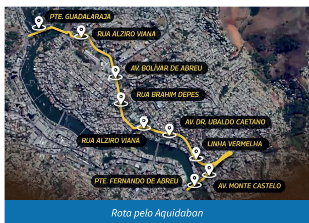
Rota pelo Aquidaban

Iniciada na última segunda-feira (30), a obra de macrodrenagem está sendo executada entre as