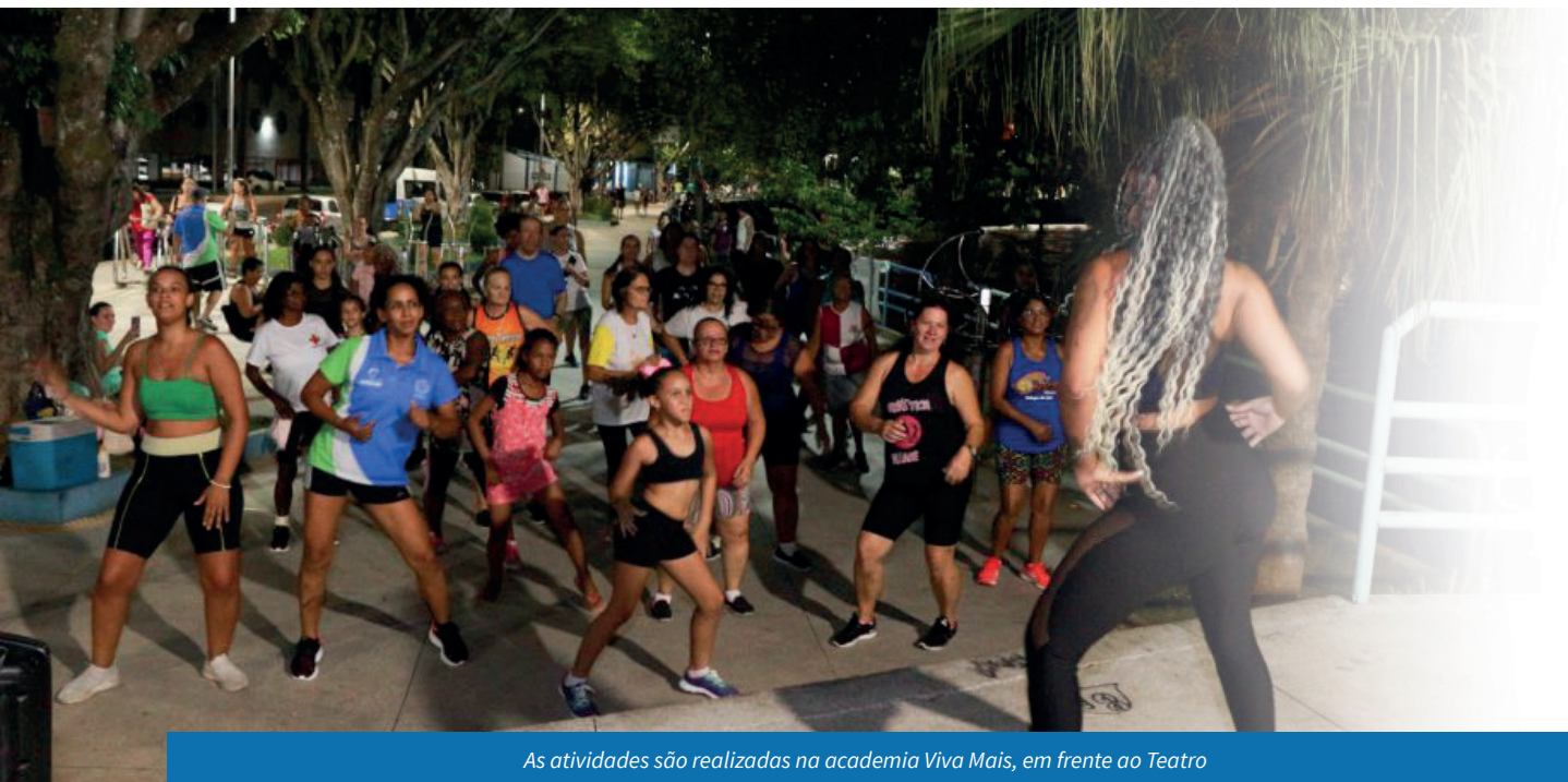
As atividades são realizadas na academia Viva Mais, em frente ao Teatro