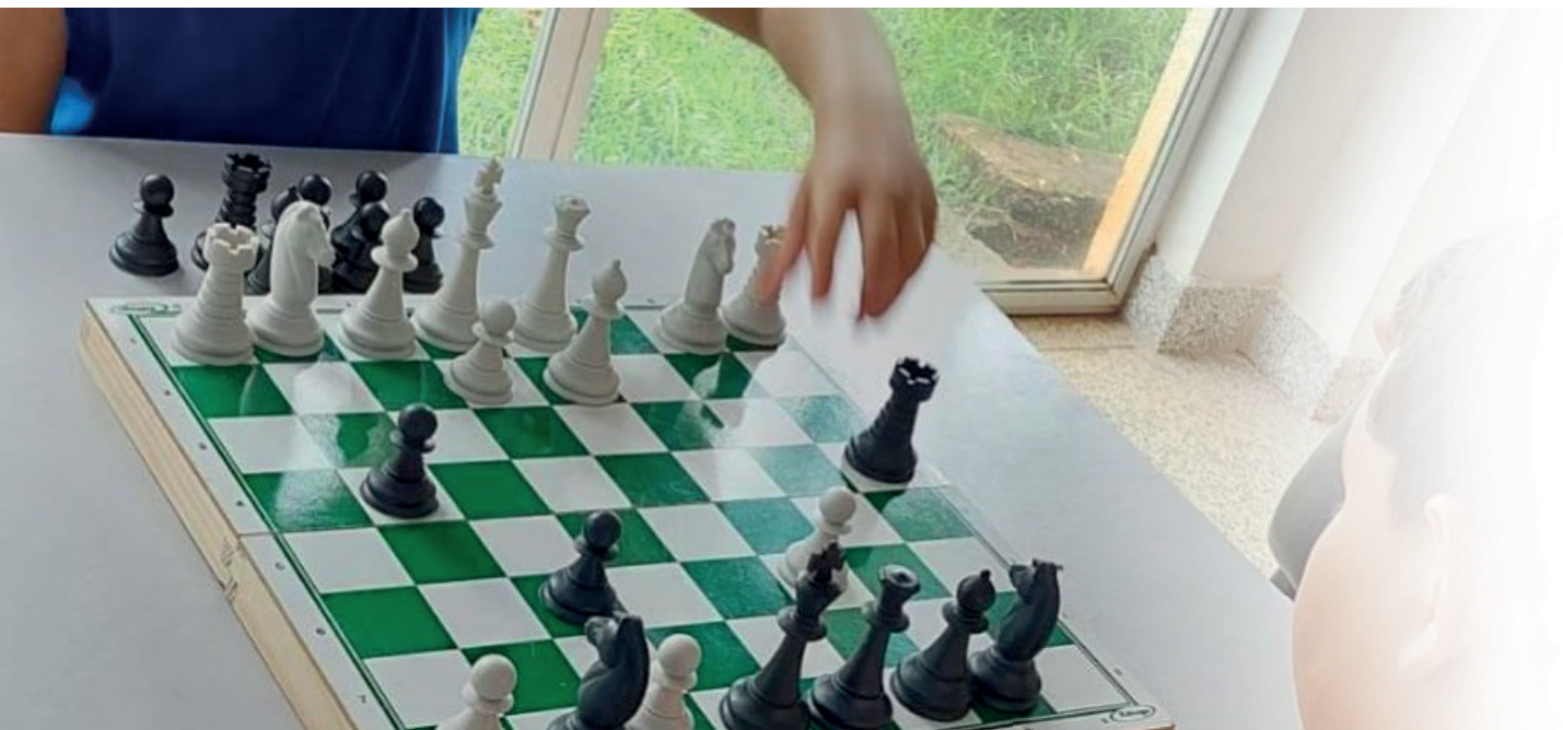
Participantes foram apresentados aos conceitos e regras do jogo