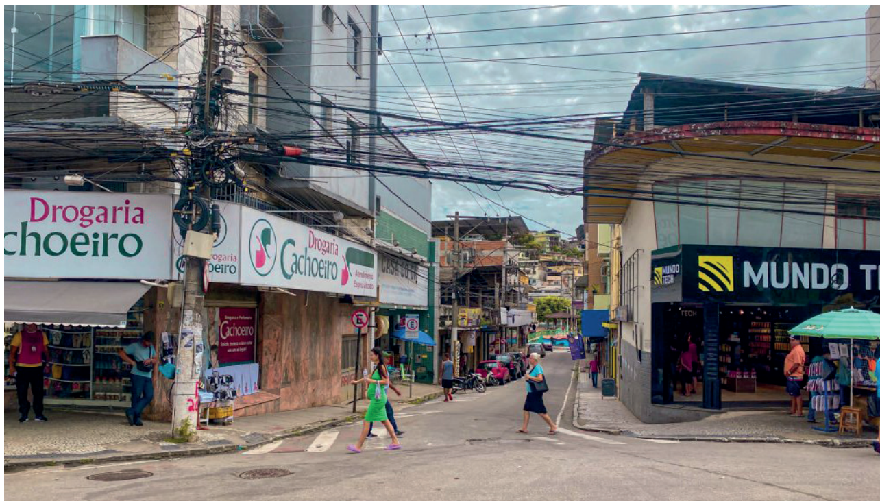
Rua Pedro Dias é uma das vias do Centro que receberão obras