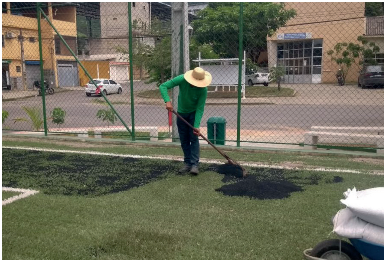
Campo de futebol será entregue em breve

Com investimento de R$347.980,18, fruto de con-