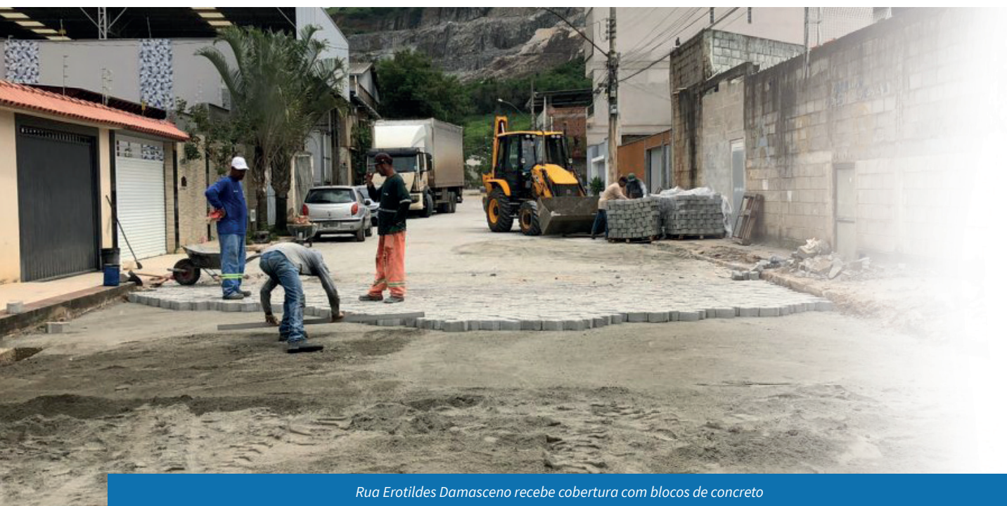
Rua Erotildes Damasceno recebe cobertura com blocos de concreto