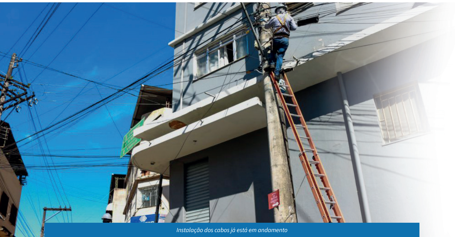
Instalação dos cabos já está em andamento

“A administração pública requer cada vez mais ações que modernizem os serviços ao cidadão. Uma cidade que investe em tecnologia e democratiza o acesso à internet cria diversas possibilidades e soluções inovadoras para áreas essenciais como a educação”, destaca o prefeito de Cachoeiro, Victor Coelho.