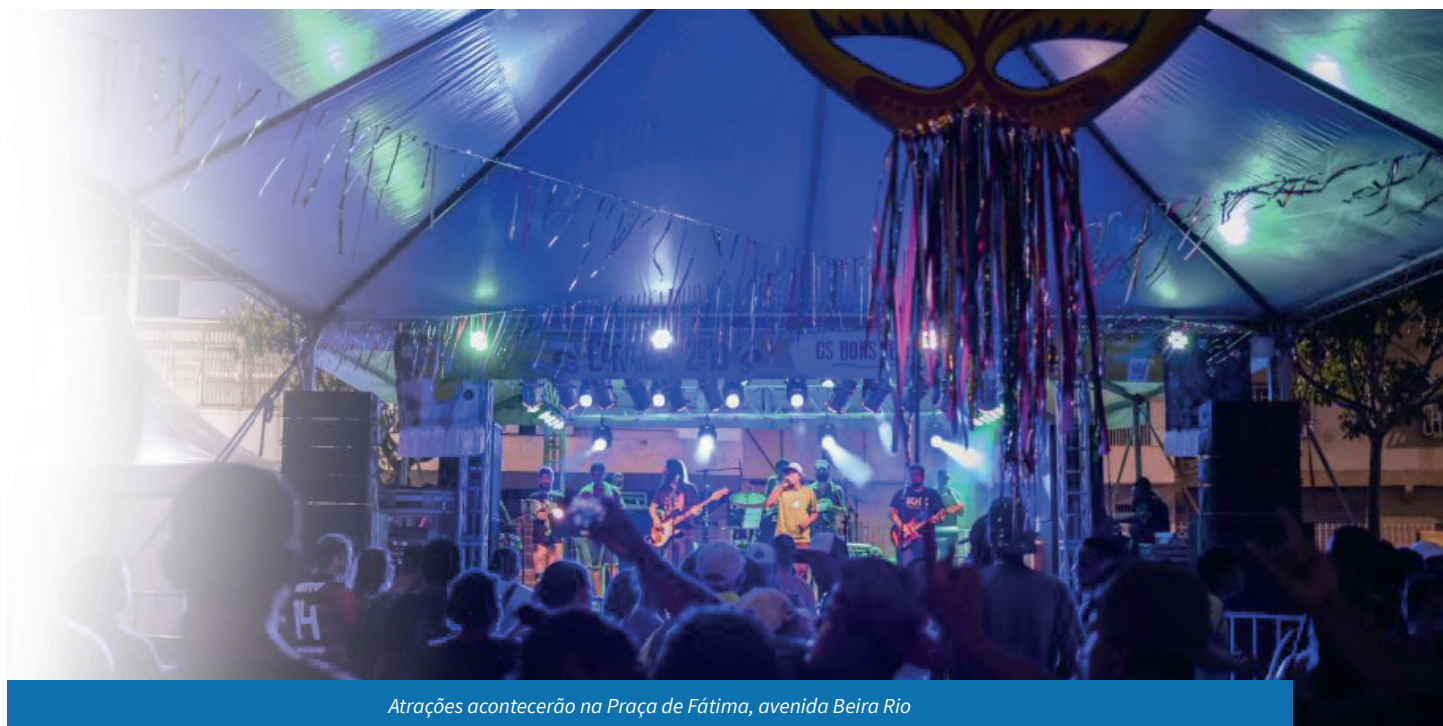
Atrações acontecerão na Praça de Fátima, avenida Beira Rio