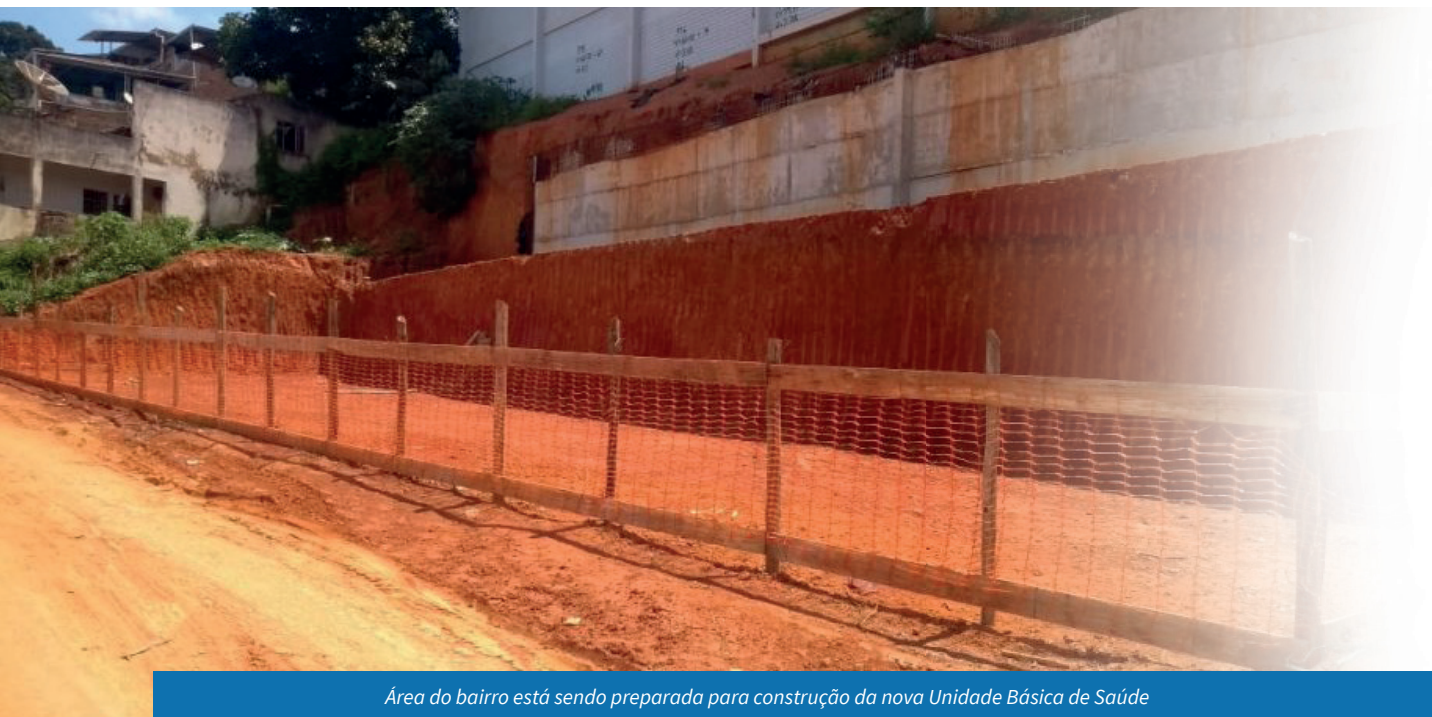
Área do bairro está sendo preparada para construção da nova Unidade Básica de Saúde