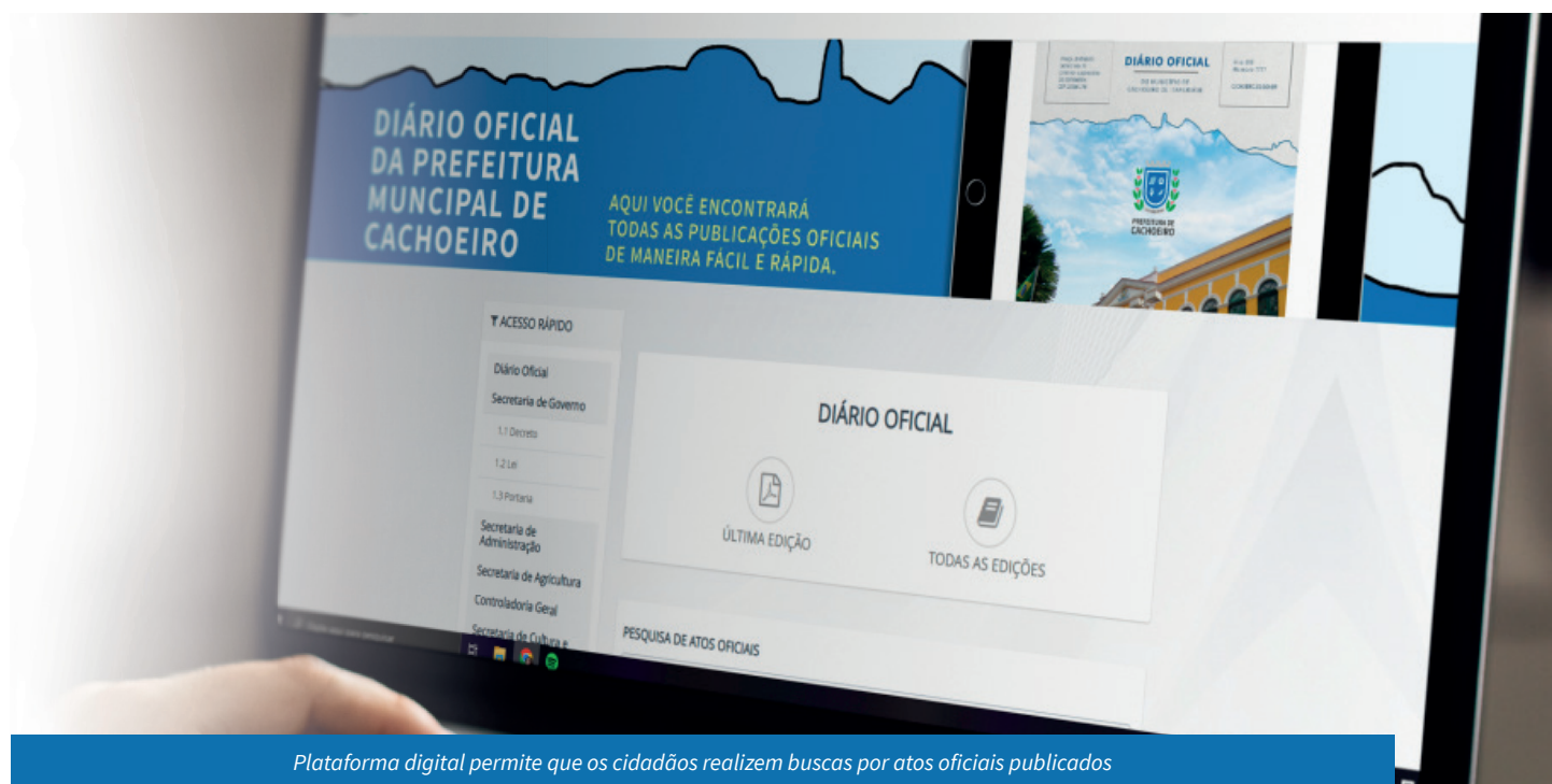
Plataforma digital permite que os cidadãos realizem buscas por atos oficiais publicados