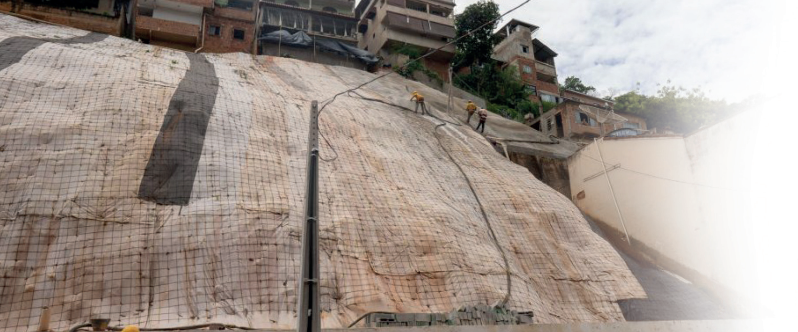
Aplicação de geocomposto tem como finalidade evitar desmoronamentos