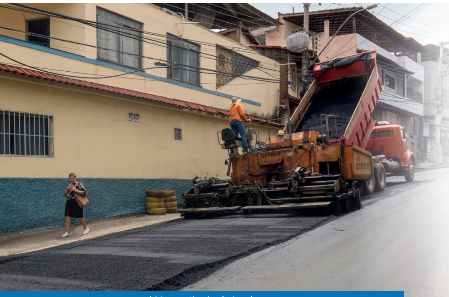
Asfalto novo está sendo aplicado na via

obras que buscam trazer mais qualidade de vida e segurança à população, e que ajudam, também, a deixar nossa cidade mais bonita”, enfatizou o prefeito Victor Coelho.