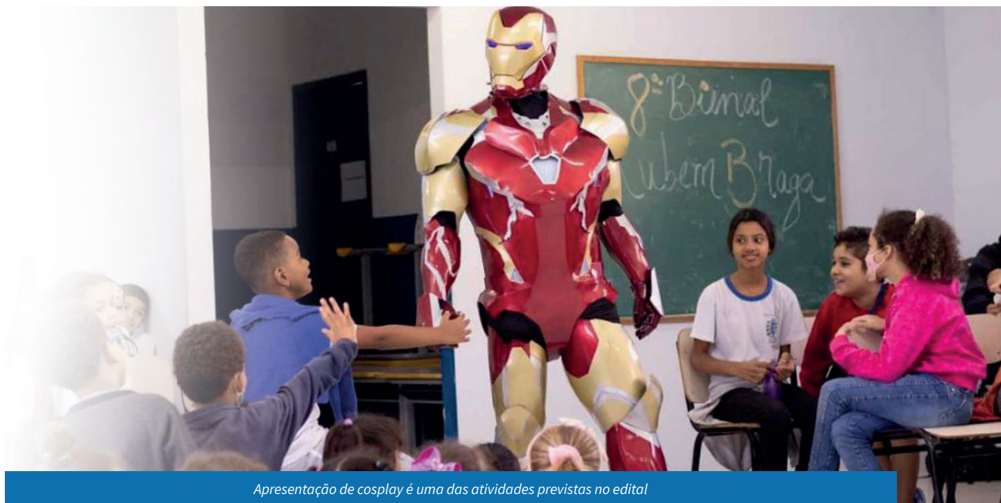
Apresentação de cosplay é uma das atividades previstas no edital