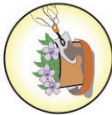
Pratinho de vaso de plantas