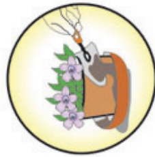
Pratinho de vaso de plantas