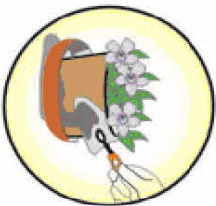
Pratinho de vaso de plantas